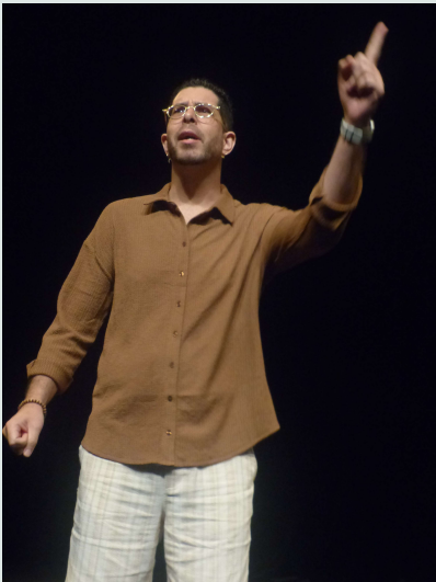
Stage Rakontaz Zitswar - La Fabrik (17/10/2025)

Kintsugi : https://baudelairenoyuuutsu.wordpress.com/2025/10/26/fonnker-kintsugi/